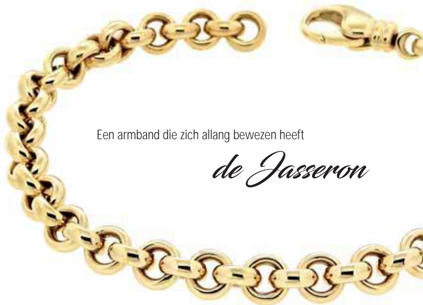
Een armband die zich allang bewezen heeft