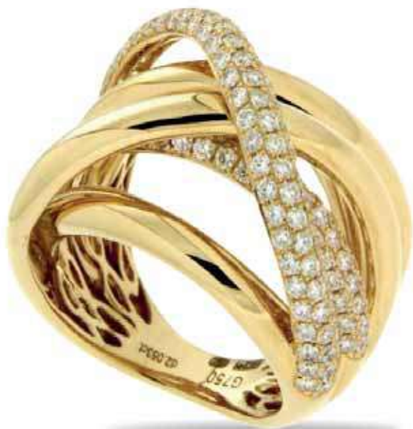
18 krt goud met 2.00 crt briljant 6300,- 3.780,- modellen kunnen variëren