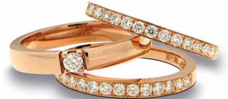
Aanschuif ringen met briljant 1.150,- 690,- per stuk

Upgrade uw (bestaande) ring met 2 mooie aan schuifringen. Zo tilt u uw eigen ring naar een heel ander niveau. Ga met gladde ringen voor een robuuste uitstraling. Ga voor briljant als u een luxueuzere look wilt creëren. Speel met verschillende kleuren goud om uw ringen te matchen bij de rest van uw outfit.