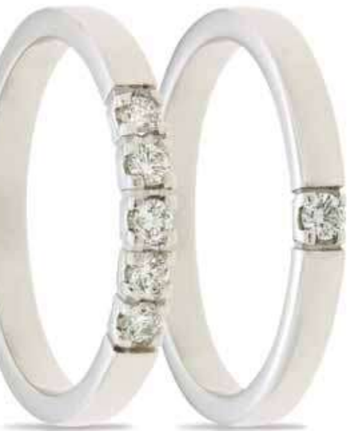
Alliancing met 1 briljant van 0.04 crt VVS Top Wesselton €357,- netto